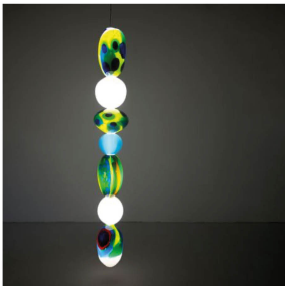
Emerald 2, Camilla Moberg (gal. Maria Wettergren)

Luminaire Emerald 2, série Messengers in Glass, Camilla Moberg (2023). Verre soufflé à la bouche, aluminium, acier, acrylique, silicone, LED. Dimensions : 28 x 190 cm. Prix sur demande. www.mariawettergren.com