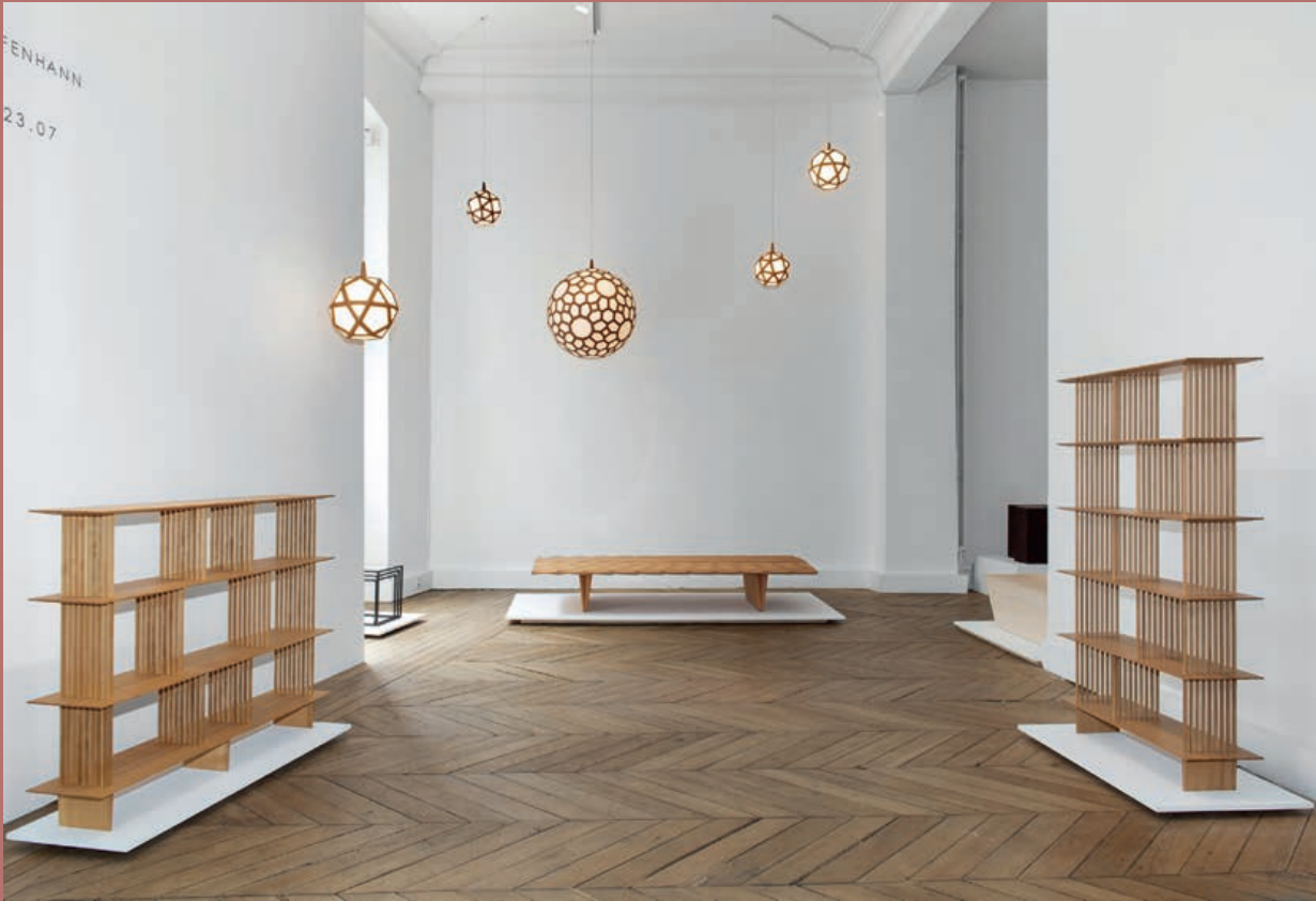
LINKS Exhibition View Rasmus Fenbann, Light, 2022. Galerie Maria Wettergren, Parijs.